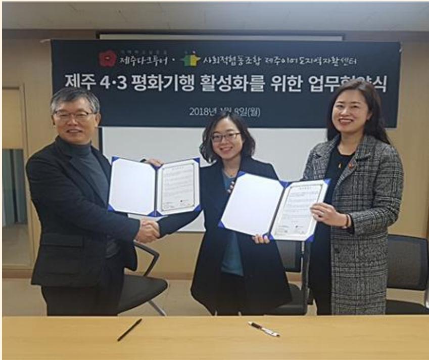
(위 사진 왼쪽)